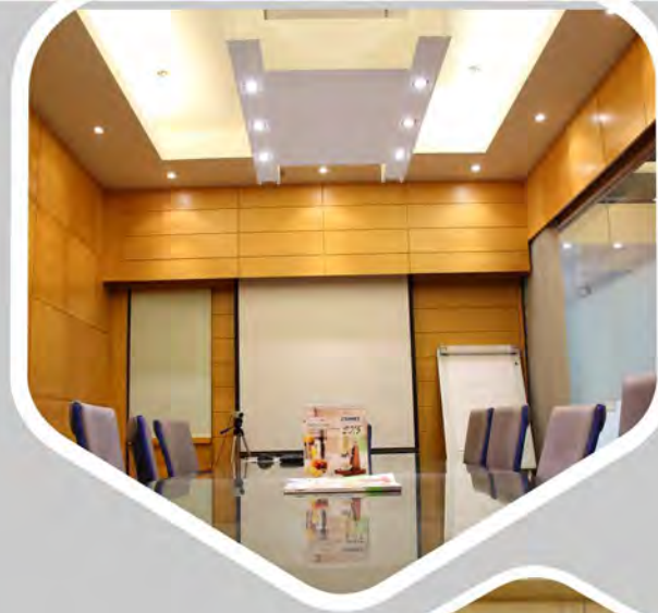
OFICINA HK ESCRITÓRIO HK

Como membro do Grupo Sunbeam, a Sunnex Products Limited foi desenvolvida em 1972. Sunnex Products Limited é uma das pioneiras na fabricação de produtos de aço inoxidável em Hong Kong.