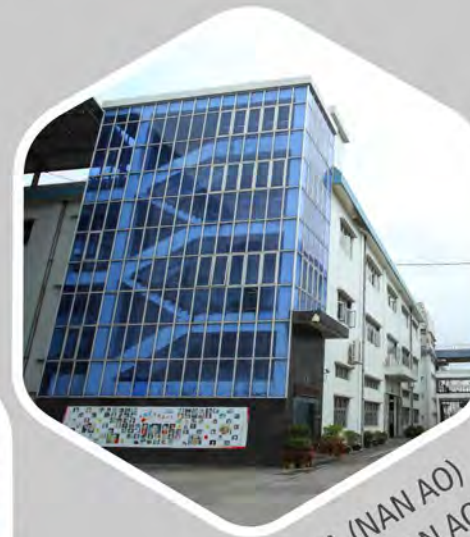
FÁBRICA (NAN AO) FÁBRICA (NAN AO)

A fábrica Nan Ao é a principal base de produção, cobrindo uma vasta gama de itens, incluindo eletrodomésticos, utensílios de bufê, serviços alimentares, talheres e produtos de utensílio de cozinha.